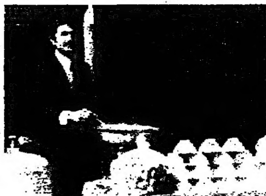
مروع جديدة للممارس